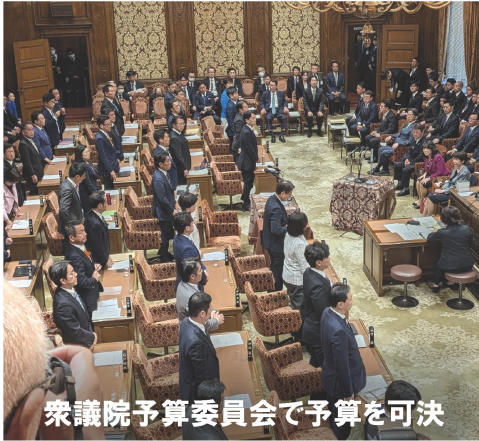
衆議院予算委員会で予算を可決