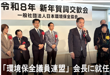
令和8年 新年賀詞交歓会 一般社団法人日本環境保全協会