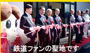
鉄道ファンの聖地です

地元・西多摩と昭島中の各地で桜まつりが行われ、大勢の住民の皆さまと一緒に、桜の花と地元産のご馳走を大いに楽しみました。ようやく春ですね！