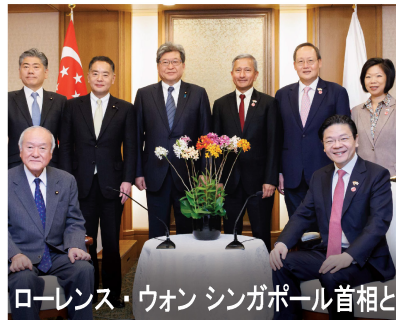
ローレンス・ウォン シンガポール首相と

日本を巡る外交・安全保障環境が戦後最も厳しく複雑と言われる中で、国民の生命・財産と日本の国益を守ることは、国会議員の最も重要な責務です。議員連盟や政党間交流などにより、世界の要人と会談しています。