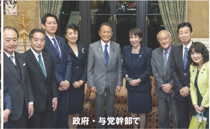
政府・与党幹部で

地元・西多摩と昭島の皆さまのおかげで連続9回目の当選を果たさせて頂いた後、休む間もなく特別国会における連日の予算審議に臨み、令和8年度予算を成立させることができました。国会審議をできる限り充実させつつも、国民生活や日本経済を守るためには予算の早期成立は最重要です。後半国会においても、イラン情勢の沈静化や物価高騰対策、多くの重要法案の成立などに全力で取り組んでまいります。