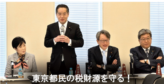
東京都民の税財源を守る！