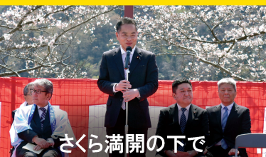
さくら満開の下で

青梅市梅郷で「観梅市民まつり」が開催されました。暖かな好天に恵まれましたが、花粉も大量に飛散しており、個人的にはかなりつらかったです?!