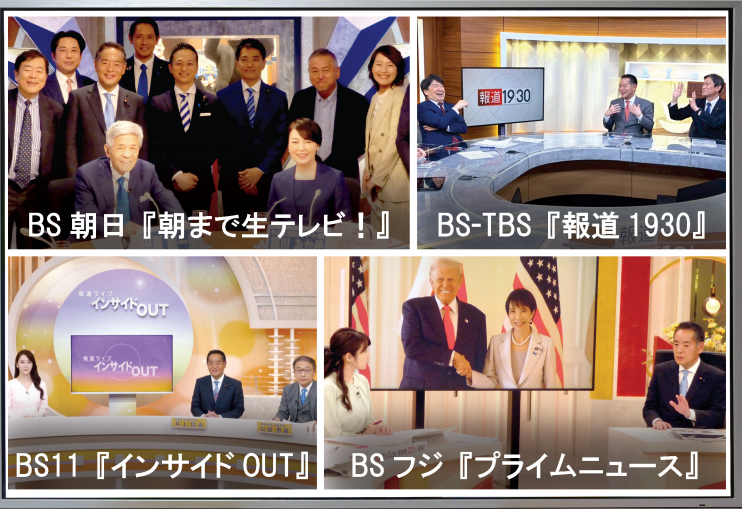
BS朝日『朝まで生テレビ!』