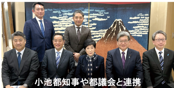
小池都知事や都議会と連携