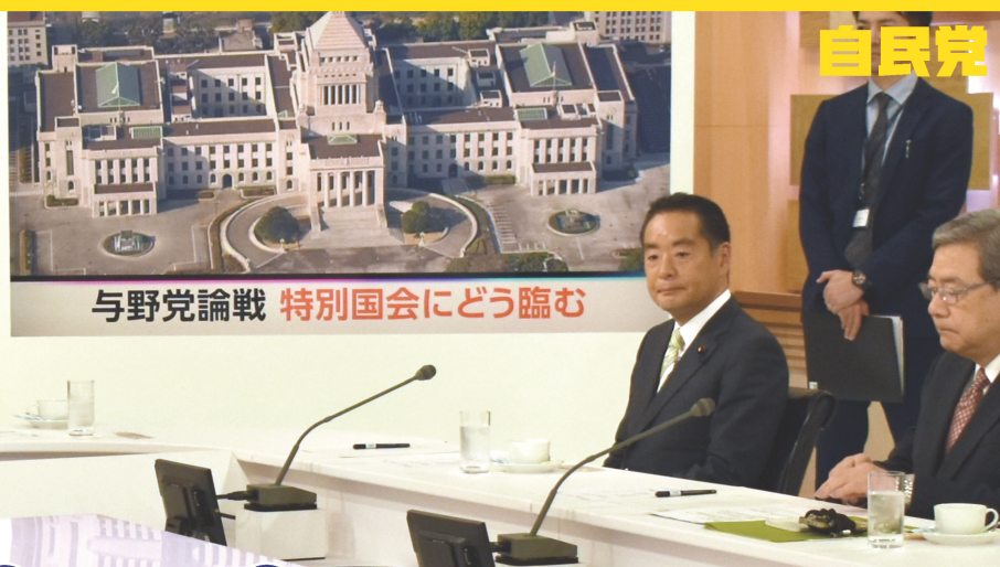
与野党論戦 特別国会にどう臨む