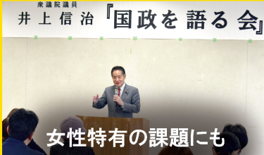
衆議院議員 井上信治 「国政を語る会」

毎年恒例の「自民党東京第25選挙区支部青年部新年会」を開催しました。小林鷹之政調会長を特別講師に招き、300名近くの若手の皆さまにご来場頂きました。