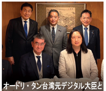
オードリ・タン台湾元デジタル大臣と