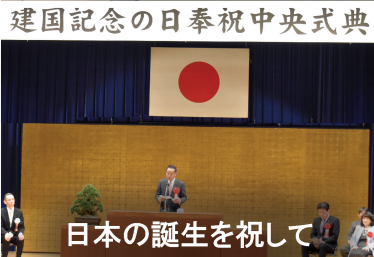
建国記念の日奉祝中央式典