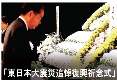
「東日本大震災追悼復興祈念式」