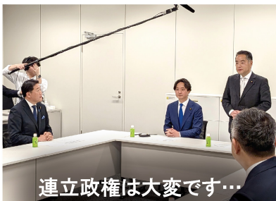
連立政権は大変です…