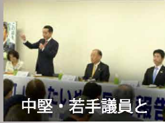
中堅・若手議員と

「自民党中古住宅市場活性化小委員長」に就任しました。中古住宅の流通や空き家問題は、私が国土交通省勤務時代から取り組んできた重要テーマです。