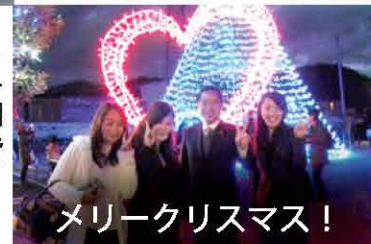
メリークリスマス!

日の出町大久野のイルミネーション点灯式に参加しました。西多摩の未来を明るくするために、地元の皆さんと一緒に取り組んで参ります。