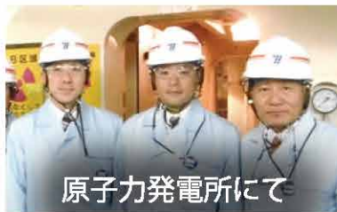
原子力発電所にて

地球温暖化対策に関する「パリ協定」発行の当日、TV 出演しました。環境副大臣を退任しても、環境問題は政治家としてのライフワークの1つです。異常気象や自然災害が頻発する中、子供たちの世代のためにも世界中が真剣に対策に取り組まなければなりません。