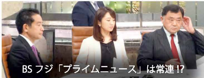
BSフジ「プライムニュース」は常連!?

地球温暖化対策に関する「パリ協定」発行の当日、TV 出演しました。環境副大臣を退任しても、環境問題は政治家としてのライフワークの1つです。異常気象や自然災害が頻発する中、子供たちの世代のためにも世界中が真剣に対策に取り組まなければなりません。