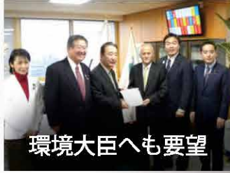
環境大臣へも要望

「眼科医療政策推進議員連盟」事務局長として、会長の田村憲久前厚生労働大臣らとともに、国民の目の健康や QOL の向上のために取り組んでいます。