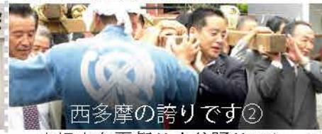
西多摩の誇りです②

青梅スイーツプラムにおいて、毎年恒例の自民党東京25区女性部「新緑の集い」を開催し、丸川珠代環境大臣をはじめ300名以上の女性の皆さんにお集まり頂きました。