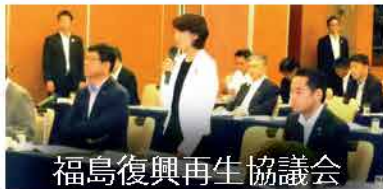
福島復興再生協議会

環境・経済産業・復興の3大臣と福島県知事をメンバーとする、国と福島との重要な会議にも何度も出席しています。