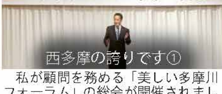
西多摩の誇りです①

私が顧問を務める「美しい多摩川フォーラム」の総会が開催されました。環境副大臣としても、地元の皆さんと協力して多摩川をはじめとする西多摩の美しい自然を守ります!