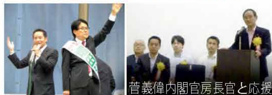
菅義偉内閣官房長官と応援