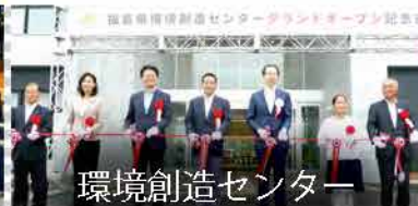
環境創造センター

環境・経済産業・復興の3大臣と福島県知事をメンバーとする、国と福島との重要な会議にも何度も出席しています。