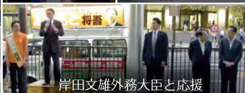
岸田文雄外務大臣と応援