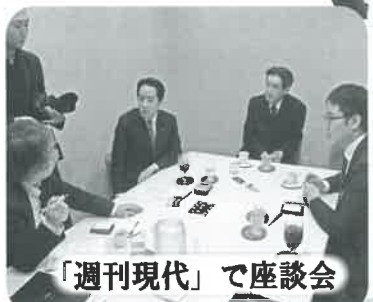
「週刊現代」で座談会