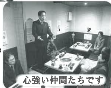
心強い仲間たちです

東京25区青年部の中からも、おかげさまで多くの地方議員が誕生しました。「西多摩若手議員の会」として、定期的に勉強会等を開いています。