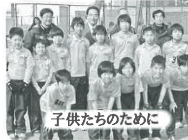
子供たちのために

日本の未来を担う健全な子供たちを育てていくのは、私たち大人の責任です。私が卒業した青梅青年会議所の少年サッカー教室に参加しました。