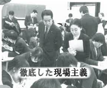
徹底した現場主義

国会にいたるだけでは様々な政治課題を実感することはできません。「影の内閣」文部科学副大臣としても、多くの教育現場等を訪問しています。