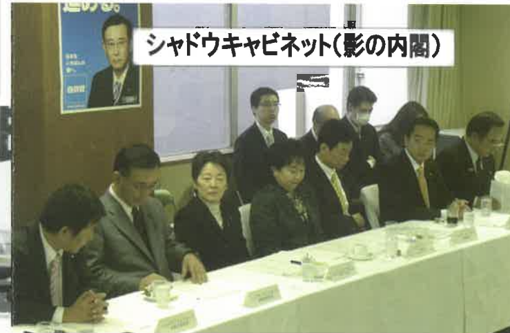
シャドウキャビネット(影の内閣)

いよいよ第180回通常国会が開会されました。震災復興や原発事故の克服、景気回復、行財政改革、外交・安全保障の立直し等、国政の課題は山積しています。私たち自民党は、政府・与党の批判をするだけでなく、「自民党ならこうする!」ということを政権公約としてまとめ上げ、国民の皆さまに訴えていきます。