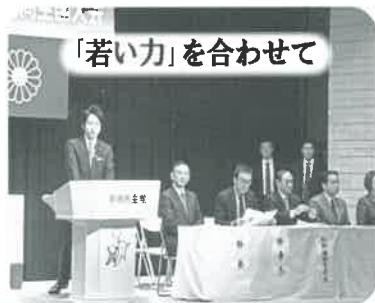
「若い力」を合わせて

私の後任である小泉進次郎青年局長の下、青年局の全国大会が開会されました。私たち若手こそが日本の未来を真剣に考えなければなりません。