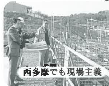
西多摩でも現場主義

西多摩の発展を実現するためには、西多摩をより深く知ることが重要です。瑞穂町の企業による環境施設の整備予定地を視察しました。