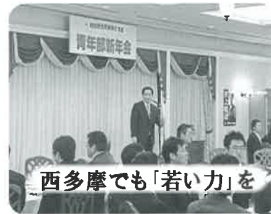
西多摩でも「若い力」を

今年も約200名の若手が参加し、恒例の東京25区青年部新年会が盛大に開催されました。西多摩の明るい未来のために、一緒にがんばろう!