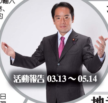
活動報告 03.13 ~ 05.14

GWには「日本・台湾経済文化交流を促進する若手議員の会(会長:岸信夫前外務副大臣)」のメンバーとして台湾を訪問し、大きな問題となっている日本の食品・食材の輸入規制強化につき、早期解除を確約させました。