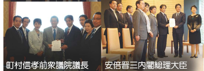
町村信孝前衆議院議長