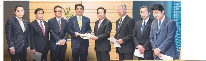
安倍晋三内閣総理大臣