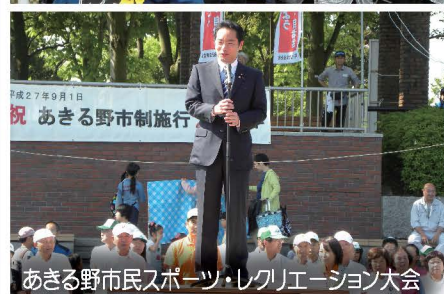
あきる野市民スポーツ・レクリエーション大会