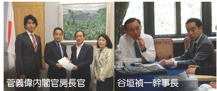
菅義偉内閣官房長官