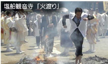
塩船観音寺「火渡り」