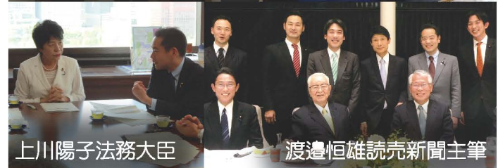
上川陽子法務大臣