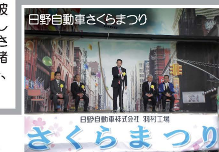
日野自動車さくらまつり

国会論戦も本格化して多忙ではありますが、できるだけ多くの時間を作って参加し、私自身も大いに楽しんでいきます。