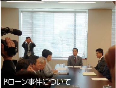
ドローン事件について

衆議院に複数ある常任委員会の中でも、内閣委員会は最も所管の広い重要な委員会です。総理官邸のドローン事件についても、早速その対応を与野党間で協議しました。