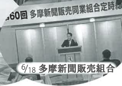
6/18 多摩新聞販売組合