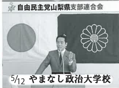
5/12 やまなし政治大学校