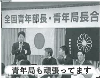
青年局も頑張ってます

3年間務めた青年局長は退任しましたが、引き続き、小泉進次郎現青年局長や全国約20万人の若手メンバーと一緒に活動しています。