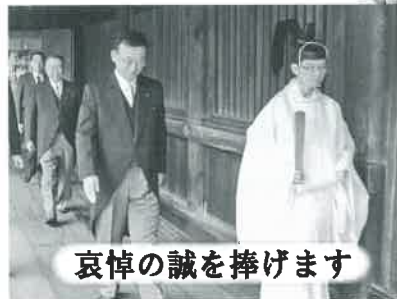
哀悼の誠を捧げます

青年局長時代から、春秋の例大祭と終戦記念日には、谷垣禎一総裁や大島理森副総裁と一緒に、自民党代表として靖国神社を正式参拝しています。