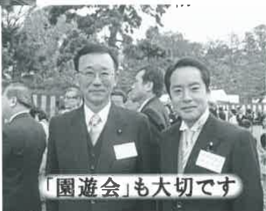
「園遊会」も大切です

春秋の園遊会も大切な公務であり、夫婦で必ず参列しています。政権交代以降、国会議員の参列者が激減しているとのこと、大変残念に思います。