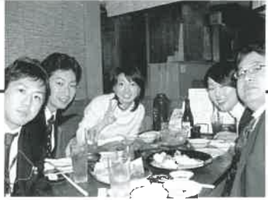
●「若手スタッフ一同、頑張ります！」

〒198-0024 東京都青梅市新町3-39-1 TEL 0428-32-8182 FAX 0428-32-8183 http://www.inoue-s.jp/