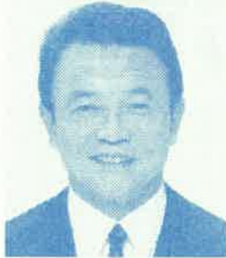
総務大臣 麻生 太郎先生