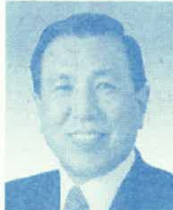
参議院議員 保坂 三蔵先生